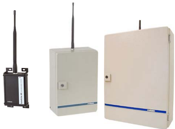
Mätstationer i Mitecs Satellite60 och RMS serier.

Med Mitec SmartCable koncept kan givare för tryck, temperatur, nivå, flöde, energi och mycket mer anslutas utan omvandlare eller "svarta lådor". Mätagivare läggs till enkelt och identifieras automatiskt.