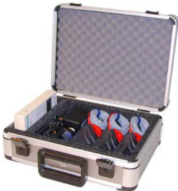
Mitec el-mätväska MV40-SW